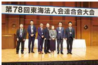
運営研究発表のメンバー