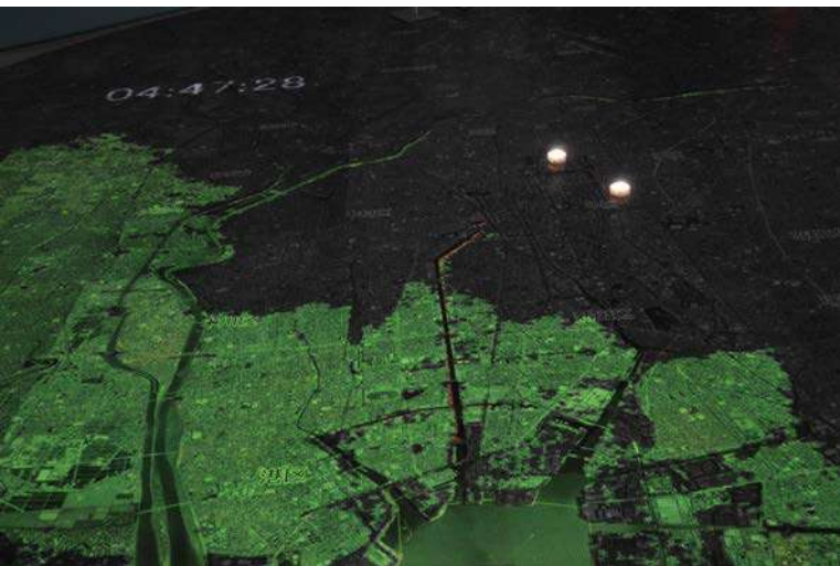
地震発生後、4分47秒後の津波の到達範囲