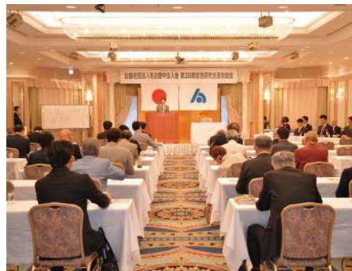
東京第一ホテル錦 2F会議室(プリランテ)

～地域の人々に笑顔をもたらす会員増強事業・ 会員の親睦を目的とした会員交流事業・ 若者たちに租税について学んでいただく社会貢献事業～