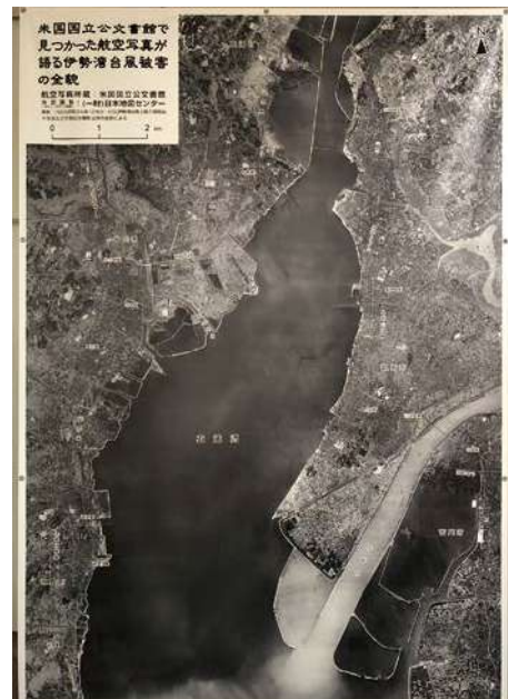
伊勢湾台風2週間後の航空写真 減災ホール（1階）