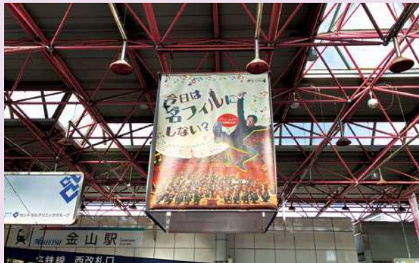
金山総合駅コンコースに掲げられたバナー 多くのお客様からSNSなどで「撮りました」と反響があります (写真・文/名フィル広報の渥美さん)