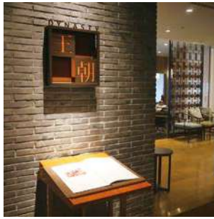
ヒルトン名古屋 王朝