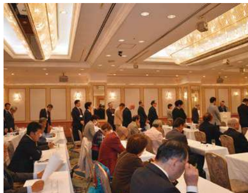
経営研究会新役員の皆様