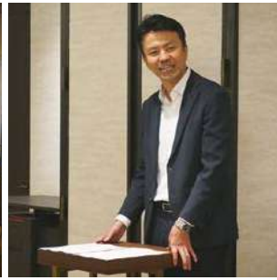
河合名古屋中税務署統括官