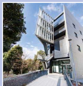
名古屋大学 東山キャンパス 減災館

今年は伊勢湾台風から65年という節目の年で、この秋に特別企画展を予定しています。過去に取り扱った際は、記録された事実を並べた“百科事典”的な展示でしたが、今回は最新の研究成果に基づき、より深いテーマに焦点を当てて開催します。地元の皆様には、ぜひご覧いただけることを願っています。