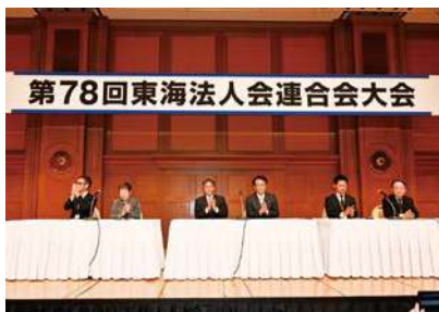
名古屋観光ホテル 3F那古の間