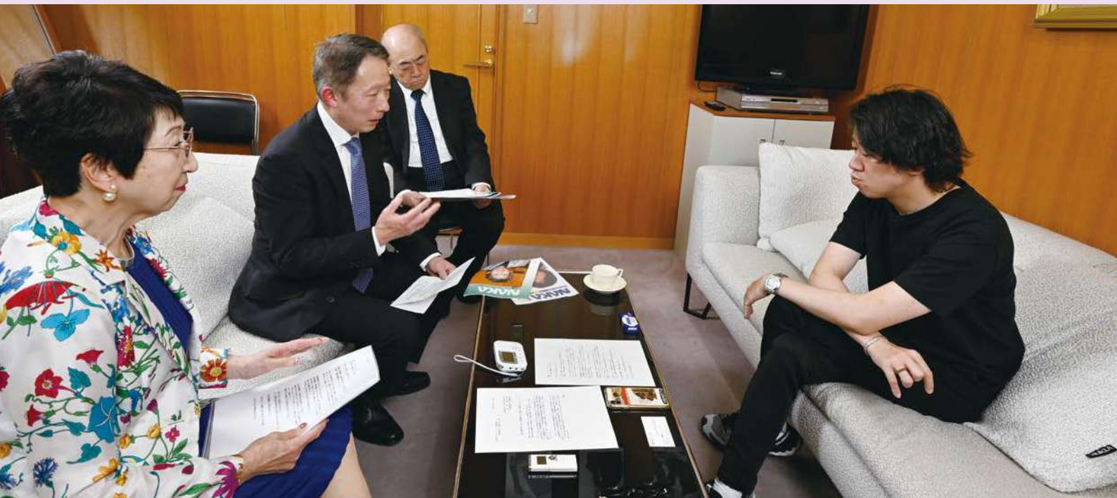
名古屋音楽プラザ 名フィル音楽監督室

に怒る」というテーマで運命をメインに演奏されるプログラムです。大切にしている事はありますか？