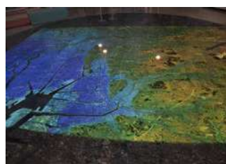
海拔ゼロメートル地帯