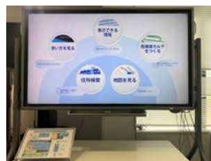
減災ライブラリー (2階)