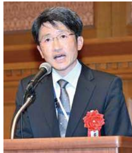
吉沢名古屋国税局長