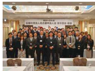
第四十三年度青年部会役員