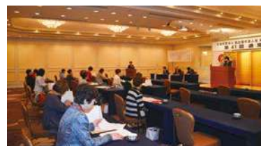
名古屋東急ホテル 4F 調べの間