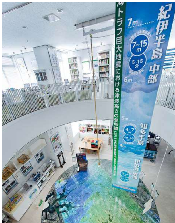
南海トラフ巨大地震における津波の高さの参考値を表す懸垂幕