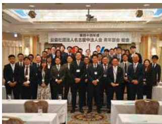
第四十四年度青年部会役員